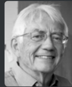
Architect, designer and professor Knud Holscher

New production methods and more efficient operation have also made it possible for us to offer MILEWIDE at still more competitive prices – particularly if you take into consideration the benefits to society due to reduced personal injury (passive safety) when the equipment is run into. Additionally, the very limited need for maintenance and the longevity of the equipment is advantageous.