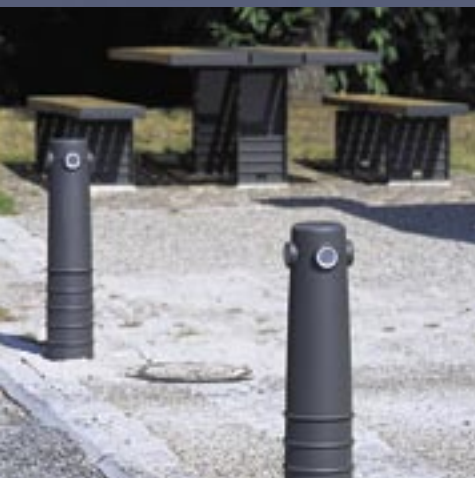
By-, park- og rastepudsudstyr Town, park and picnic area equipment

MILEWIDE consists of a comprehensive range of equipment. Visit milewide.dk and have a look at all your options.