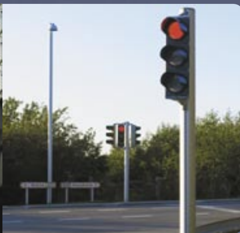
Master til belysning, skilte og signalanlæg Masts for lighting, signs and signals

Den gode rådgivning er en del af det gode produkt. Når du har valgt MILEWIDE, har du truffet et godt valg. Det unikke og komplette produktprogram er suppleret med en kompetent og serviceorienteret organisation, der altid står til rådighed med information, rådgivning og hurtig respons. Kontakt os gerne for en uformel samtale om de mange muligheder for at følge dit projekt frem til en gennemført succes.