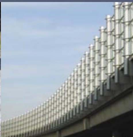
Støjskærme Sound screens